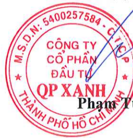
Phạm Tự Trọng